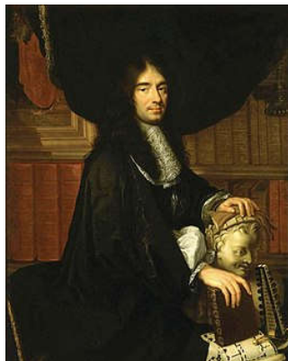
Philippe Lallemand, Charles Perrault (1628-1703) Peint en 1671